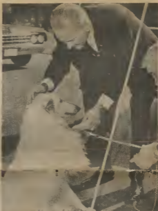
JOHNSON A REGRESA NA CASA BLANCA

Washington - Presidente Johnson awe a regresa Casa Blanco, despues di un esto